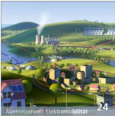
Abenteuerwelt Elektromobilität 24