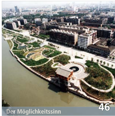
Der Möglichkeitssinn 46