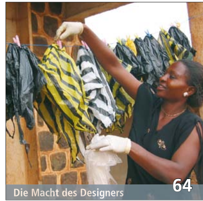
Die Macht des Designers 64