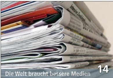
Die Welt braucht bessere Medien 14