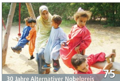
30 Jahre Alternativer Nobelpreis