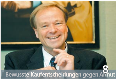
Bewusste Kaufentscheidungen gegen Armut 8