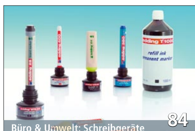
Büro & Umwelt: Schreibgeräte