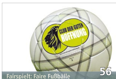
Fairspiel: Faire Fußballer