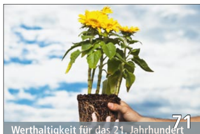
Werthaltigkeit für das 21. Jahrhundert