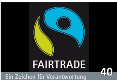
Ein Zeichen für Verantwortung 40