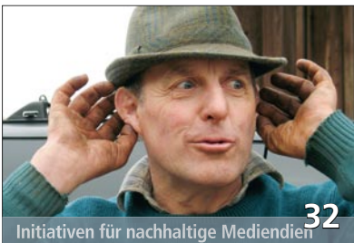
Initiativen für nachhaltige Mediendien 32