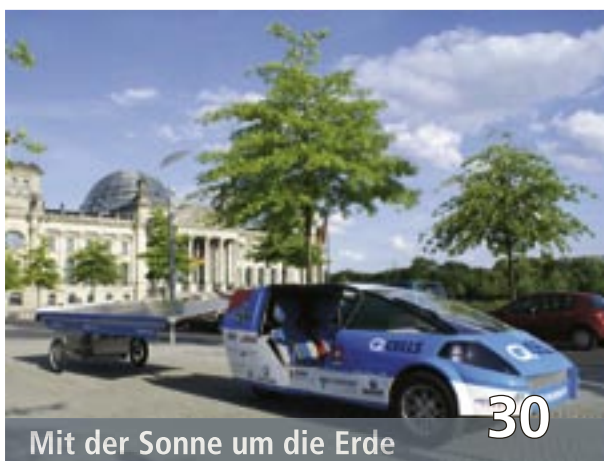
Mit der Sonne um die Erde