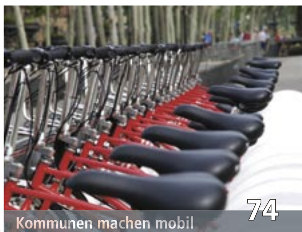
Kommunen machen mobil